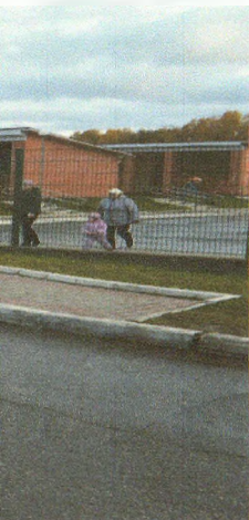
Фото на странице: 0